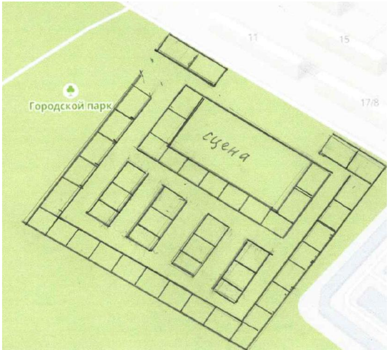
СХЕМА РАЗМЕЩЕНИЯ МЕСТ ДЛЯ ПРОДАЖИ ТОВАРОВ НА ЯРМАРКЕ