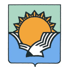
Схема теплоснабжения городского округа город Волгореченск Костромской области на 2016–2028 годы